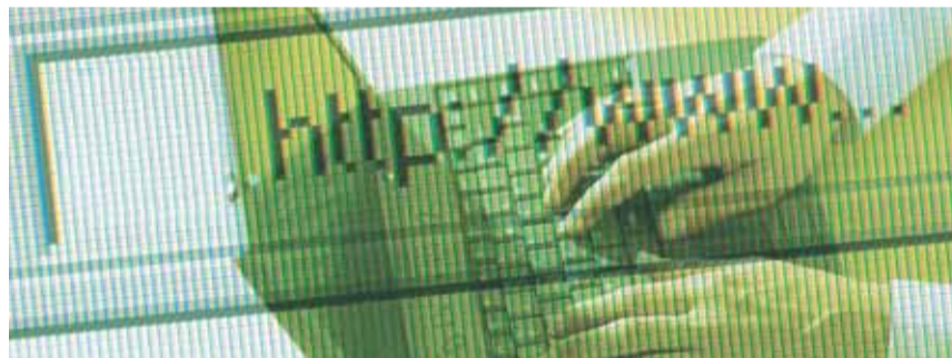
Korištenje internet bankarstva

Prema posljednjim objavljenim podacima Ministarstva gospodarstva, u Hrvatskoj je u drugom tromjesečju 2007. godine bilo ukupno 385.000 građana i 120.000 poslovnih subjekata koji su koristili e-bankarstvo, a ukupna vrijednost svih elektroničkih transakcija u godini dana iznosila je 350 milijuna eura, što je znatno manje od podataka koje smo dobili od samih banaka. Zagrebačka banka (Zaba) trenutačno ima